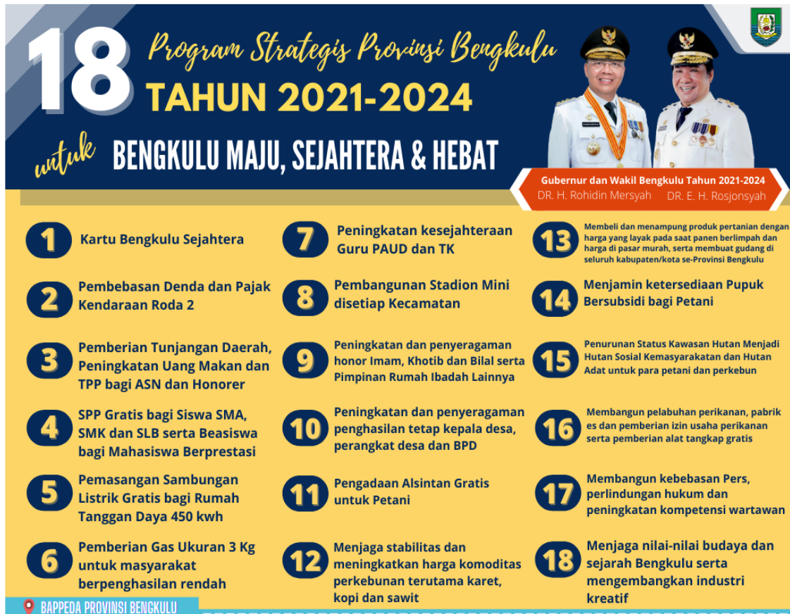
Gambar.2 Program Strategis Provinsi Bengkulu

Keterkaitan Program Strategis Janji Kampanye ke dalam Program Dinas Pariwisata adalah pada Program Strategis yang ke-18 yaitu : Menjaga nilai-nilai budaya dan sejarah Bengkulu serta mengembangkan industri kreatif. Dengan Rumusan Implementasi Program Strategis sebagai Berikut :